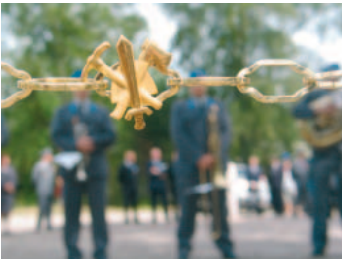
Porttiin kiinnitetty ketju.

Koulukeskuksessa vietetty avajaisjuhla päättyi Rakunasoittokunnan esittämään ”Koljonvirran marssiin”, joka