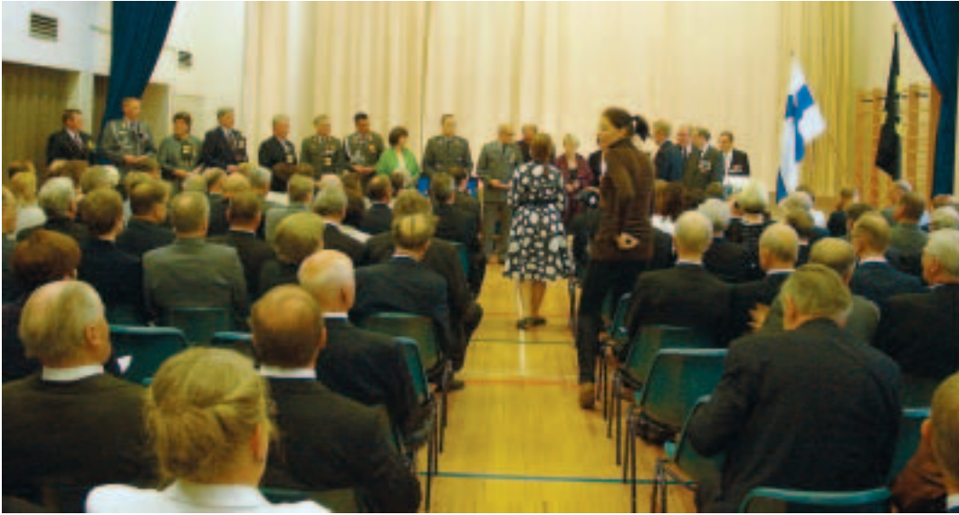
Museohankkeen toteutamisessa ansioituneita palkittiin.